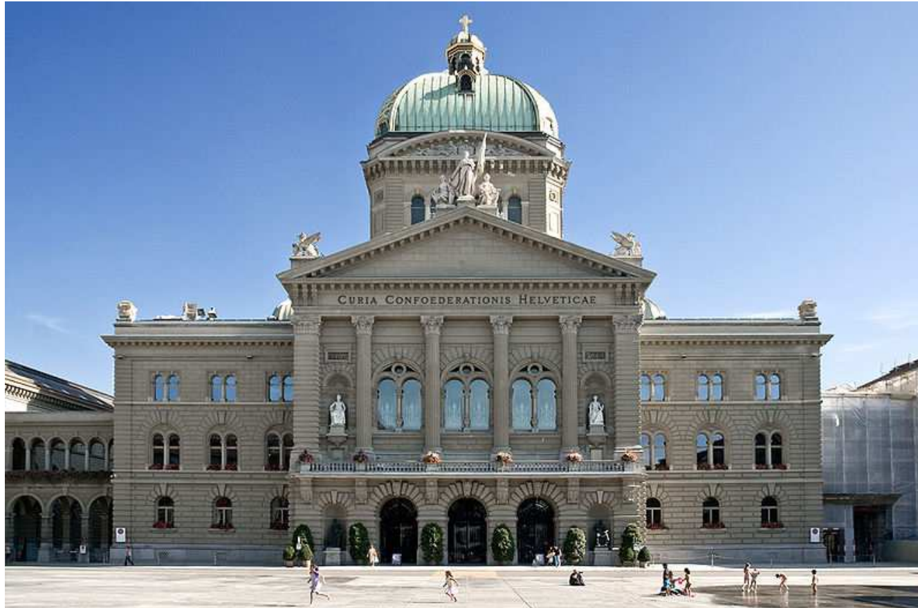
Bundeshaus Bern 2009, Flooffy“ von Flooffy - Federal Palace of Switzerland, BernUploaded by Dodo von den Bergen. Lizenziert unter CC BY 2.0 über Wikimedia Commons - https://commons.wikimedia.org/wiki/File:Bundeshaus_Bern_2009,_Flooffy.jpg#/media/File:Bundeshaus_Bern_2009,_Flooffy.jpg