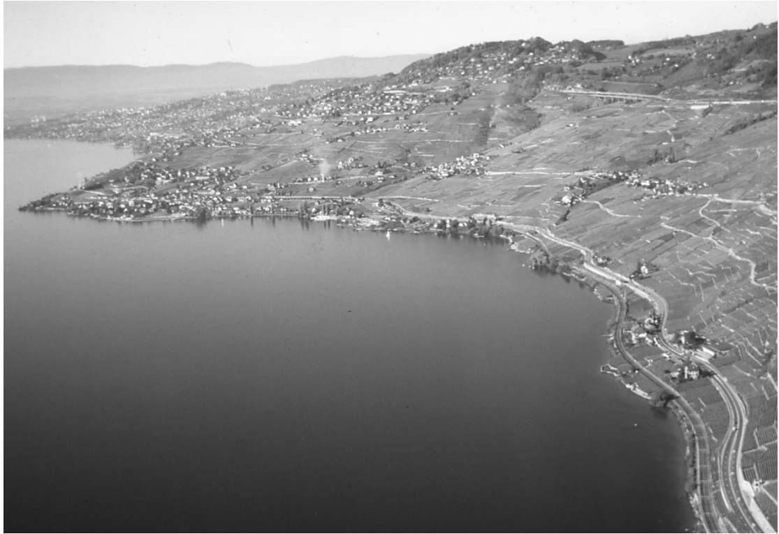
Baie de Cully