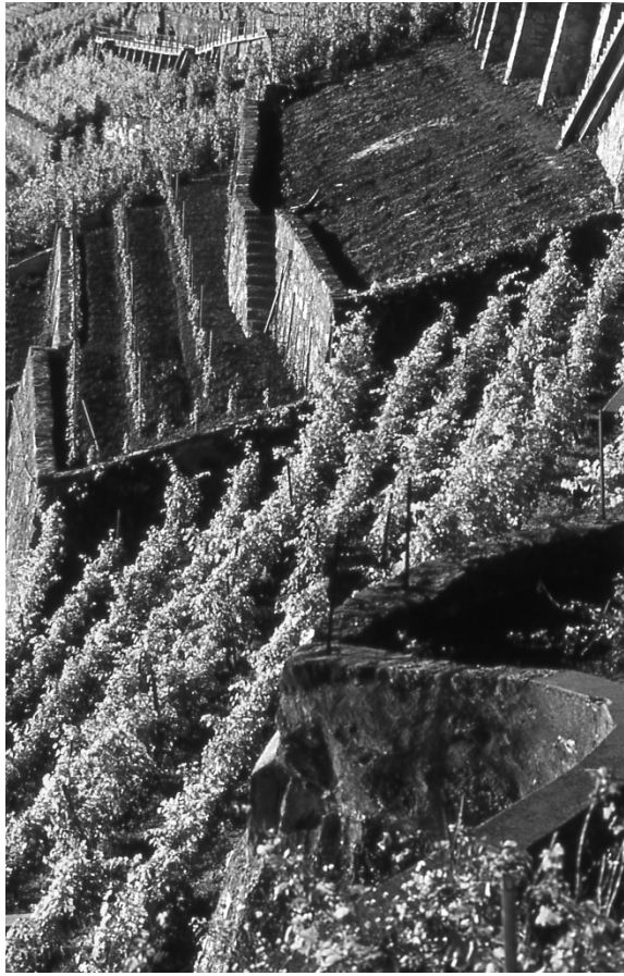
Murs près de Rivaz