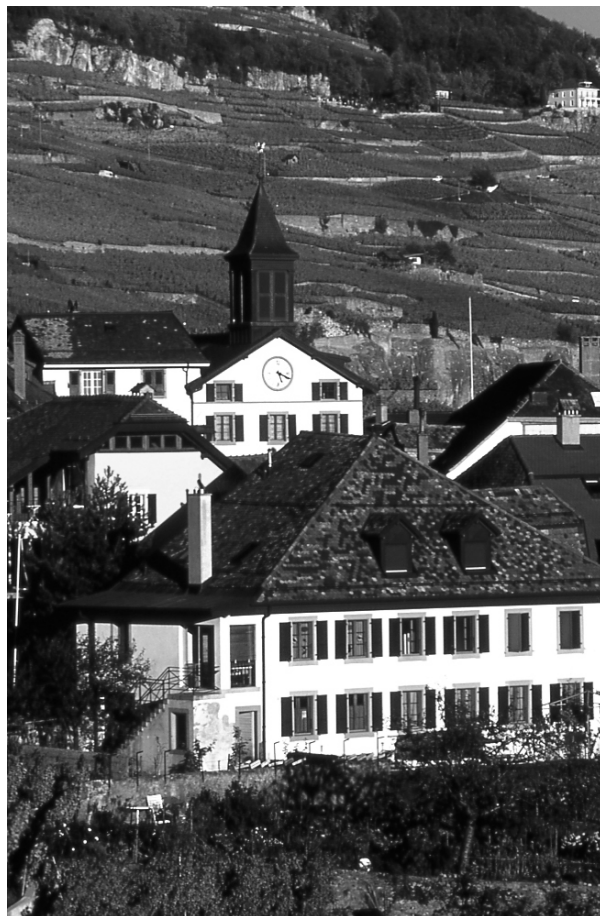
Village de Rivaz