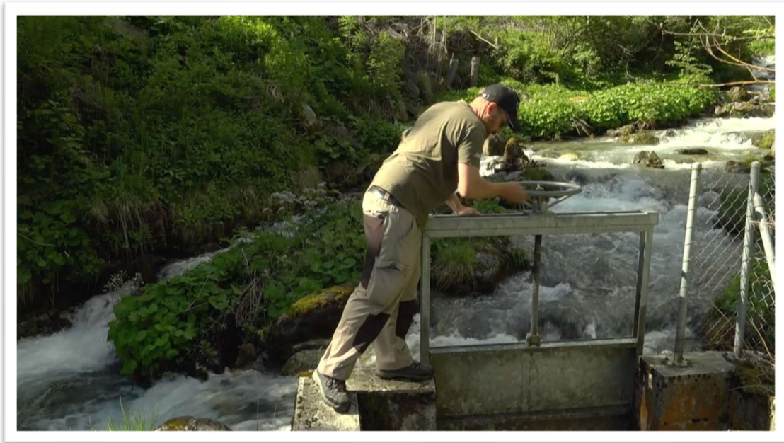
Garde du Bisse du Milieu, Nendaz

Titre du projet: Les chemins de l'eau: une plateforme pour fédérer des initiatives Organisation: Association du Musée valaisan des Bisses