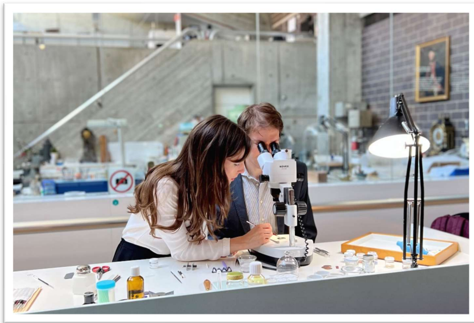
Transmission des bonnes pratiques dans le domaine de la préservation du patrimoine horloger

Titre du projet: Formation continue en préservation du patrimoine horloger (2023-2024) Organisation: Musée international d'horlogerie, La Chaux-de-Fonds