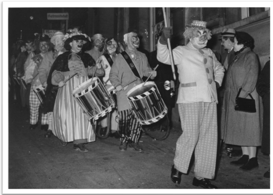
Unbekannter Fotograf, die Basler Mittwoch-Gesellschaft am Fasnachtsdienstag, 1954, Fotografie, Archiv Basler Mittwoch-Gesellschaft.

Projekttitel: Dokumentation Basler Fasnacht Organisation: Verein «Dokumentation Basler Fasnacht»