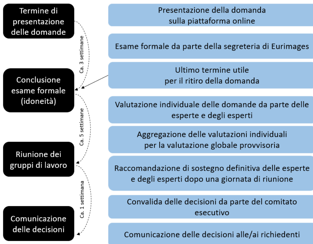
Figura 1: esame delle domande di sostegno alla coproduzione

L'intero processo, dalla presentazione della domanda alla comunicazione della decisione, dura tra le nove e le dieci settimane.